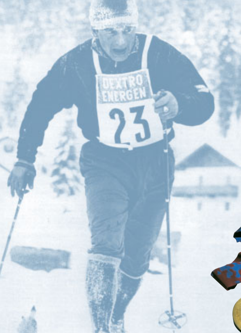
Georg Thoma, Reit im Winkel, 1966