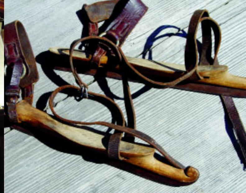
Schlittschuhe, Ende 19. Jh.