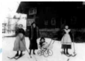
Historische Ansicht vom Hugenhof